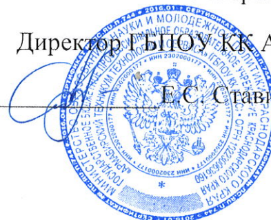
График аттестации педагогических работников на соответствие занимаемой должности на 2023 – 2024 учебный год